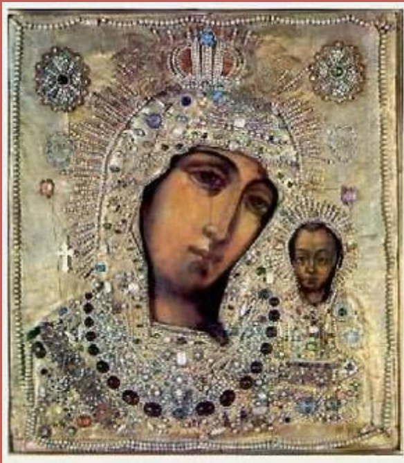
Икона Казанской Божьей Матери