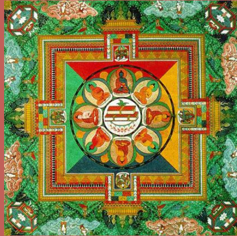
Скульптуры и изображения Будды