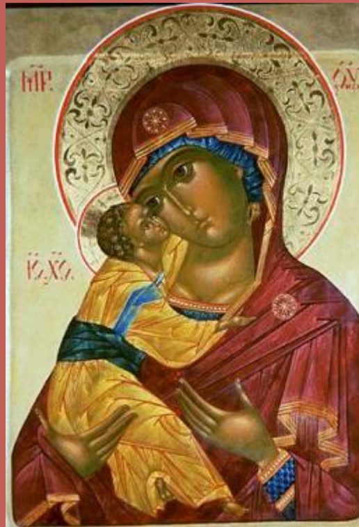
Икона Владимирской Божьей Матери