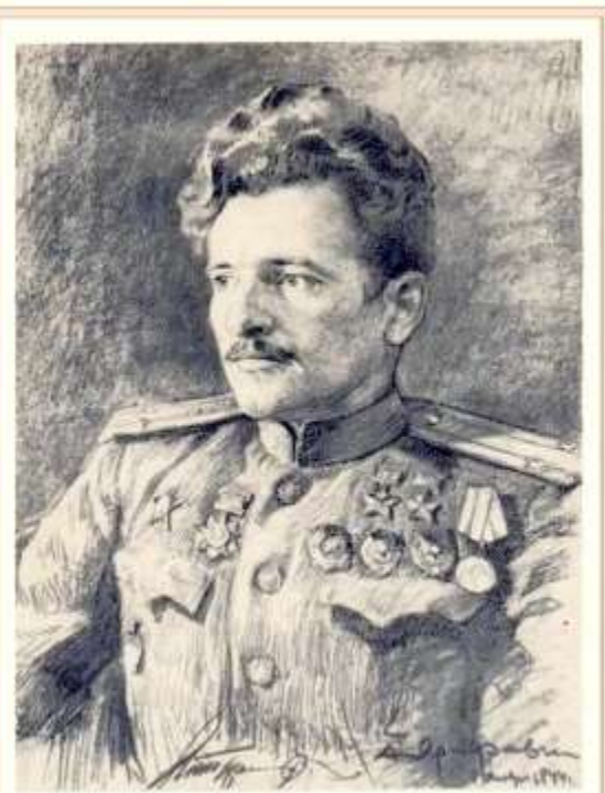
Портрет П. А. Покрышева работы художника Яр-Кравченко.

24 августа 1943 года, в день своего рождения, П.А.Покрышев был награждён второй медалью «Золотая Звезда» и стал дважды Героем Советского Союза