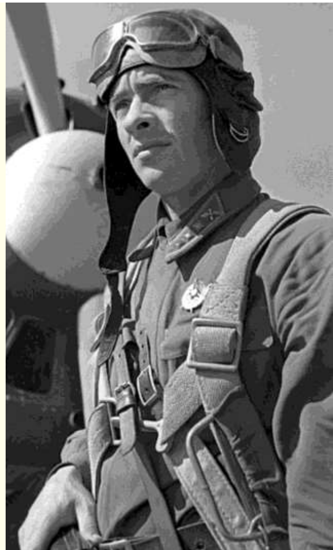
Фотогазета 154-го истребительного авиационного полка