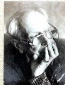
Д. С. Лихачев